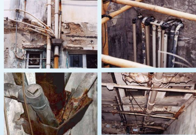
供水及排水系統破損、失修