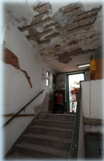
石屎爆裂，鋼筋外露