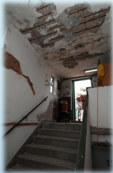
石屎爆裂，鋼筋外露