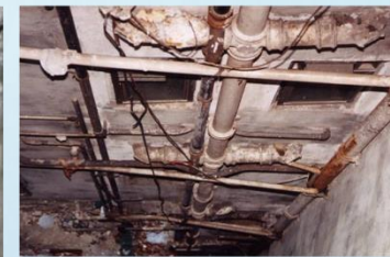
供水及排水系統破損、失修