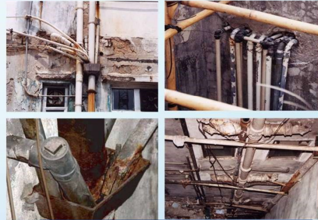
供水及排水系統破損、失修