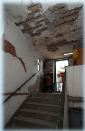
石屎爆裂，鋼筋外露